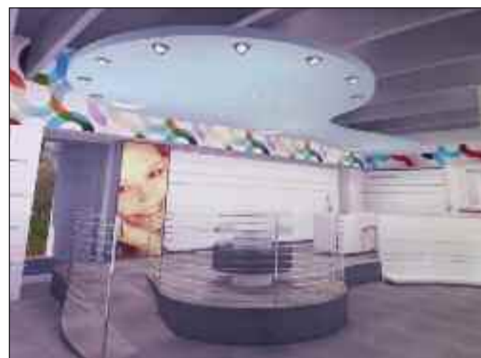
La nuova farmacia in allestimento

Più numeroso è, invece, l'indotto che ruoterà attorno alla nuova farmacia, se si considera che la stessa dovrà appoggiarsi a un laboratorio di analisi (per poter garantire il servizio prelievi del sangue) e a un ufficio Cup (centro Unico prenotazioni), che avrà il compito di fissare gli appuntamenti per i prelievi e per l'elettrocardiogramma, altro servizio che la nuova realtà comunale erogherà. Se quest'ultima dimostrerà di decollare come ci si aspetta, alla vendita di farmaci e agli esami sarà affiancata anche