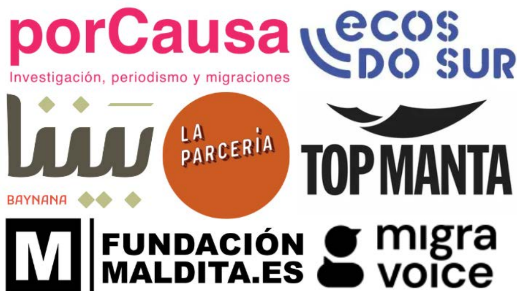
Figura 2. Ejemplos de buenas prácticas mencionados en las entrevistas

Organizaciones de fact-checking como Maldita.es también fueron reconocidas por su labor en la lucha contra la desinformación en materia de migración, destacando especialmente el papel de su iniciativa Migravoice, que se destacó como un ejemplo de colaboración transfronteriza que integra a expertos con antecedentes migratorios en la producción periodística como fuentes y colaboradores. Proyectos como La Parcería (LP) y la labor de comunicación y defensa de colectivos como Top Manta en Barcelona también se citaron como ejemplos poderosos de prácticas mediáticas transformadoras basadas en la comunidad. Todas estas iniciativas fueron percibidas como espacios en los que periodistas, activistas y miembros de la comunidad reimaginan colectivamente la cobertura de la migración sin reproducir jerarquías de voz o mirada.