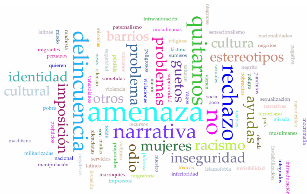
Figura 3. Nube de palabras de las narrativas y estereotipos dominantes percibidos sobre las personas migrantes en España

de los estereotipos y prejuicios hacia los migrantes, los refugiados y las personas de origen migratorio. Todos los encuestados coincidieron en que la mayoría de los estereotipos giran en torno a tres ejes principales: la seguridad y la delincuencia, el uso percibido de los recursos públicos (como el bienestar y el empleo) y los temores relacionados con la pérdida de la identidad nacional.